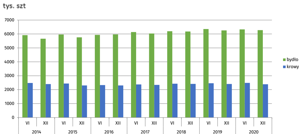
Wykres 1. Pogłowie bydła, w tym krów w latach 2014-2020

W strukturze stada bydła ogółem udział poszczególnych grup wiekowo-użytkowych w grudniu 2020 r. wynosił: