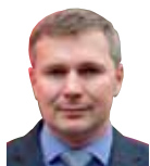
Krzysztof Płocki Zdjęcia: firmowe, autor

Obecnie linia talerzowych agregatów Ares reprezentowana jest przez typoszeregi: L, XL, P, HP i Roller Up. Montowane są w nich talerze o średnicach wynoszących od 500 do 660 mm (informuje o tym liczba podana przy nazwie). Mogą one mieć zabezpieczenie poprzez amortyzatory gumowe lub sprężynę. Ponadto dostępne są